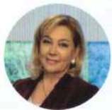
Арина Шарапова Телеведущая

Дорогие мои! Хочу поговорить с вами о важной теме! Участились случаи мошеннических действий с использованием сети Интернет! Злоумышленники стремятся обманным путем завладеть вашими денежными средствами и имуществом! Их жертвами зачастую становятся граждане пожилого возраста . Эта памятка поможет вам сориентироваться в экстренной ситуации и сохранить свои денежные средства от преступных посягательств! Соблюдение ряда простых правил позволит вам и вашим близким чувствовать себя в безопасности!