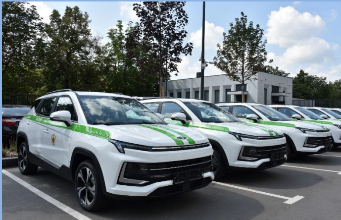
Служебный автотранспорт ФКУ УИИ ГУФСИН России по г. Москве

Уголовно-исполнительные инспекции являются учреждениями уголовно-исполнительной системы Российской Федерации, исполняющими уголовные наказания и иные меры уголовно-правового характера, не связанные с изоляцией осужденных от общества, меры пресечения в виде домашнего ареста, запрета определенных действий и залога, а также обеспечивающими контроль за лицами, освобожденными условно-досрочно от отбывания наказания.